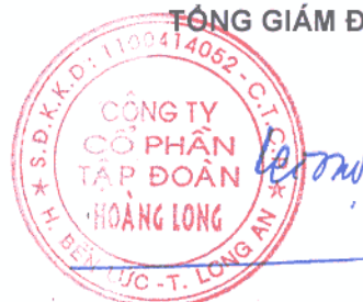
PHẠM PHÚC TOẠI